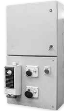
Tablero de tomas RepsoI-YPF