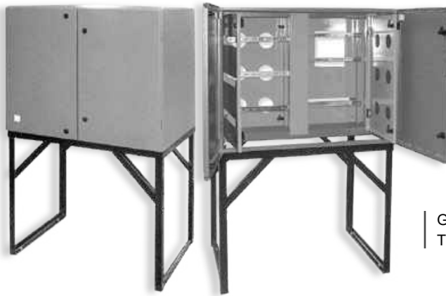
Gabinete de obra TRIELEC San Juan